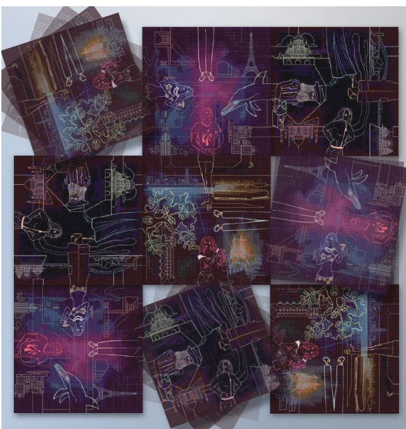
Séverin Krön Grafische Darstellung zu Worldconnexion in Permutation